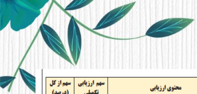
1-1) جدول شایستگی شغل آموزگاری